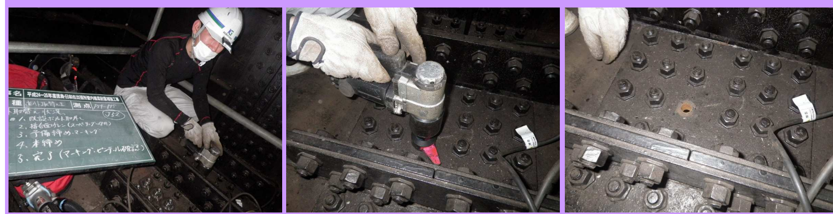
既設高力ボルト取外し